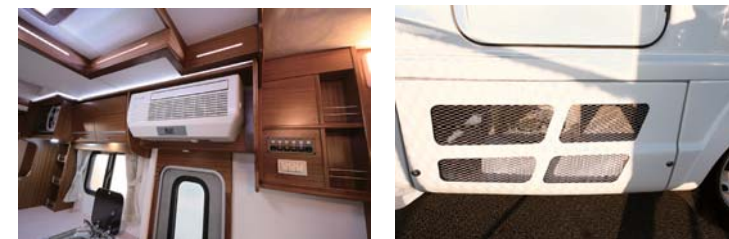
i-cool 24V 専用クーラー (オプション) 室外機は外部下になります。