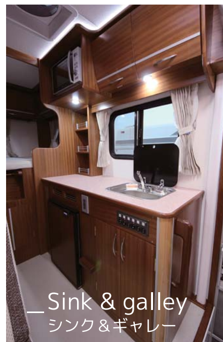
—Sink & galley シンク & ギャレー