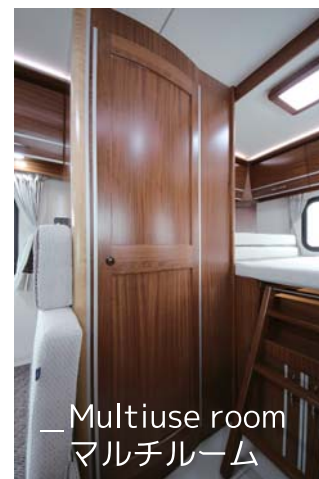
—Multiuse room マルチルーム