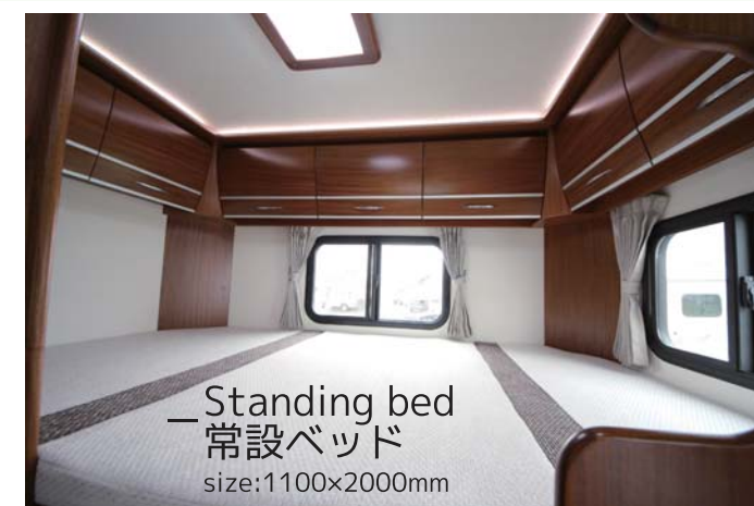
—Standing bed 常設ベッド size:1100×2000mm