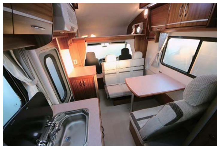
▶Floor bed (フロアベッド) size:1400×1900mm ベッド展開はセカンドシートを平らにして補助マットをはめれば完成！