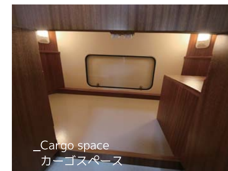
—Cargo space カーゴスペース

常設ベッドへは 小さなハシゴで 上ります。 また、ハシゴは レールにより収 納できます。