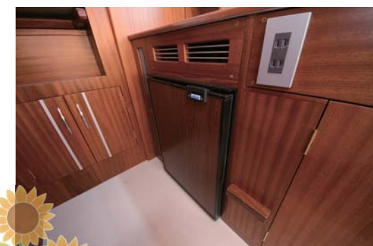
▶85L 冷蔵庫 容量も大きく沢山の食材等を収納できます。