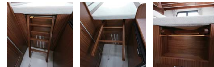
▶Ladder (常設ベッド用ハシゴ)

常設ベッドへは 小さなハシゴで 上ります。 また、ハシゴは レールにより収 納できます。