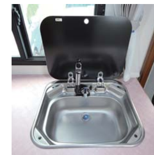
▶ステレス製シンク