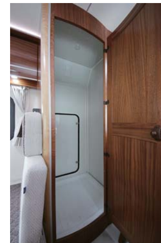
size:780×750×174 (H) mm