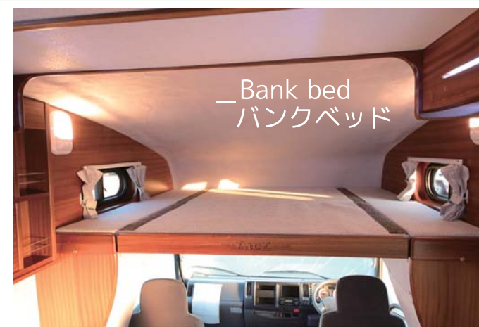
—Bank bed バンクベッド